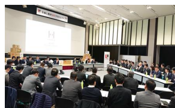
※2020年1月 HAKOPLA 定例会の様子

HAKOPLA は、リベロ提携引越会社の声から生まれました。各社の抱える共通の課題を「つながる」ことで解決するために開発したプラットフォームサービスです。これまで横の連携の難しかった引越業界で、「引越案件」「資材回収作業」「空きトラック」のマッチングによる相互協力、燃料の共同購入、など様々な施策でロスやコストを削減し、引越業界の課題を解決するだけでなく、『引越し難民ゼロプロジェクト』の発足や CO2 削減のための幹線輸送サービスの開発など、社会課題の解決にも取り組んでいます。四半期に一度、全国の HAKOPLA 参加引越会社が一堂に会する『HAKOPLA 定例会』を実施。1社1社では難しい課題を、「つながる」ことで解決していきます。