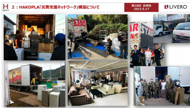
※HAKOPLA 幹事会社「スター引越センター」の活動事例

このマップは、災害時における迅速な対応や被災者のサポートに貢献することを目的としており、以下のような情報を提供しています。