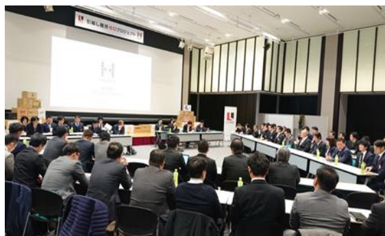
※2020年1月 HAKOPLA定例会の様子

ハコプラは、リベロ提携引越会社の声から生まれました。各社の抱える共通の課題を「つながる」ことで解決するために開発したプラットフォームサービスです。これまで横の連携の難しかった引越業界で、引越し案件や空きトラック、資材回収作業のマッチングによる相互協力による様々なロスやコストの削減から、引越業界の抱える課題解決、『引越し難民ゼロプロジェクト』の発足やCO2削減のための幹線輸送サービス開発など、社会課題の解決に取り組んでいます。四半期に一度、全国のHAKOPLA参加引越会社が一堂に会する『HAKOPLA定例会』を実施。（現在はオンラインで開催中。）1社1社では難しい課題を、「つながる」ことで解決していきます。